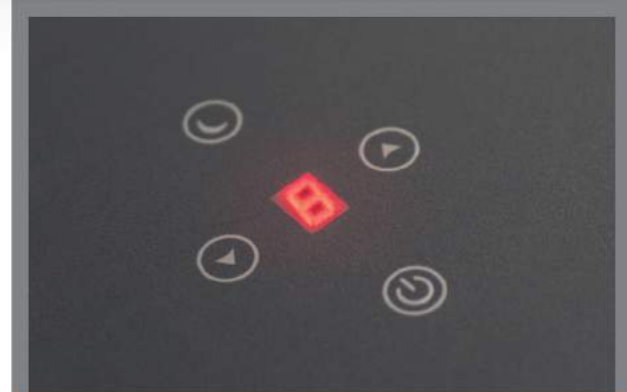
صفحه کلید و نمایشگر لمسی