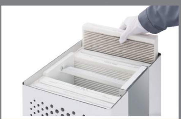
تعویض فیلتر آسان